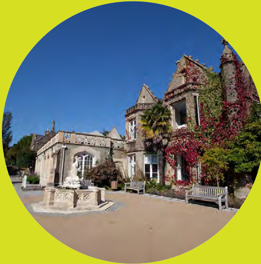
Campws y Bae